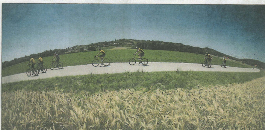
Kolesarjenje po čudoviti pokrajini je doživetje posebne vrste.