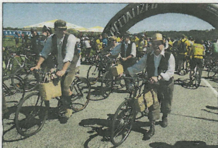
Med množico sodobnih koles so posebej izstopali starodobniki; lastniki so na svoja kolesa zelo ponosni.