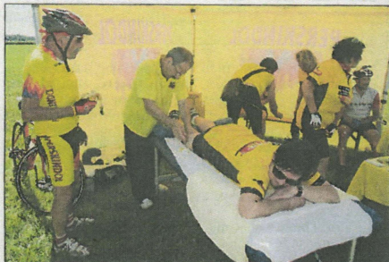
Pred maratonom in po njem bilo poskrbljeno za sprostitve utrujenih mišic.