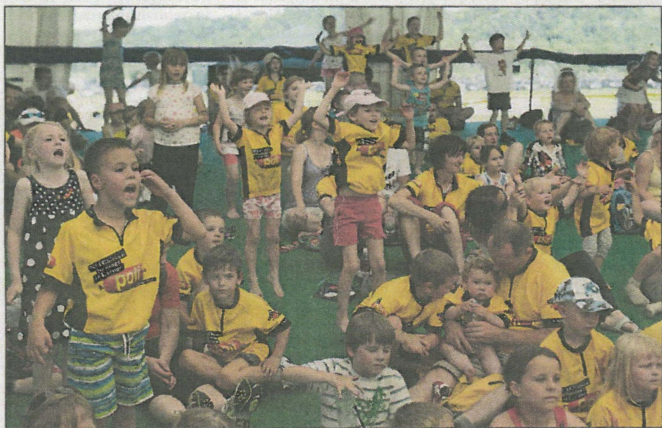
Zavzeto sodelovanje najmlajših na animacijah v otroškem šotoru