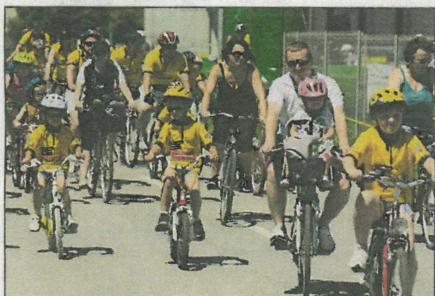
Najmlajši so se podali na 3 km dolg Poli snack maraton.