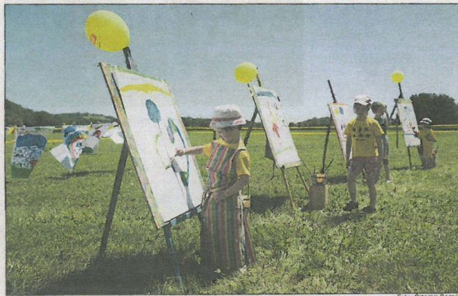
Po napornem kolesarjenju se prileže umetniško ustvarjanje ...